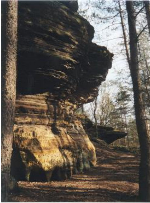
Formy skalne w rezerwacie "Skałki Piekło pod Nieklaniem"