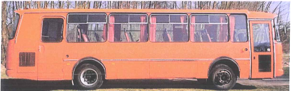
fot. 3 – prawa strona pojazdu