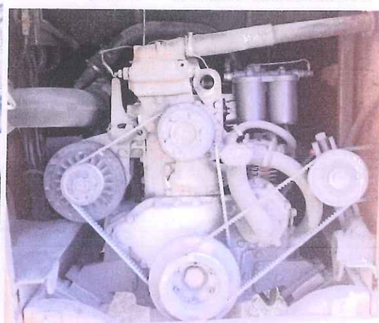
fot. 9 – silnik