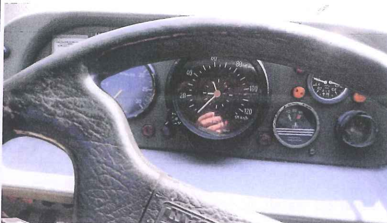
fot. 7 – zestaw wskaźników