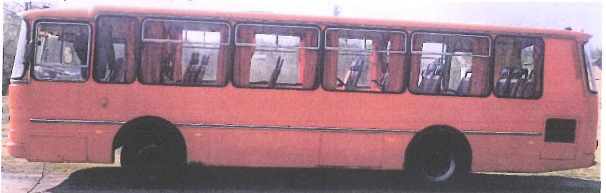
fot. 4 – lewa strona pojazdu