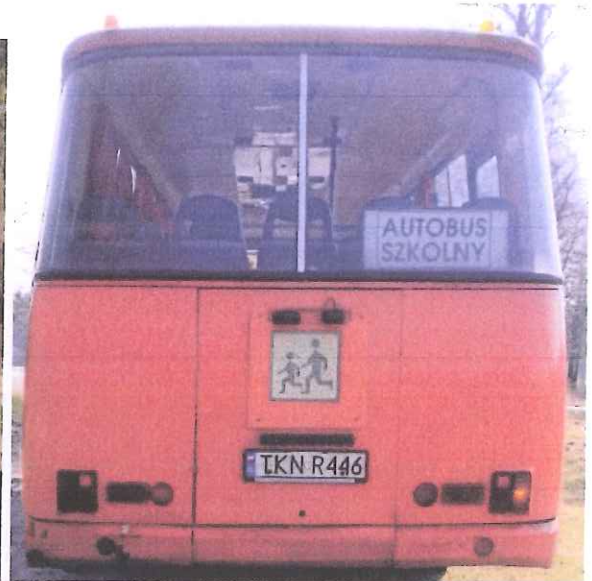
fot. 2 – tabliczka znamionowa