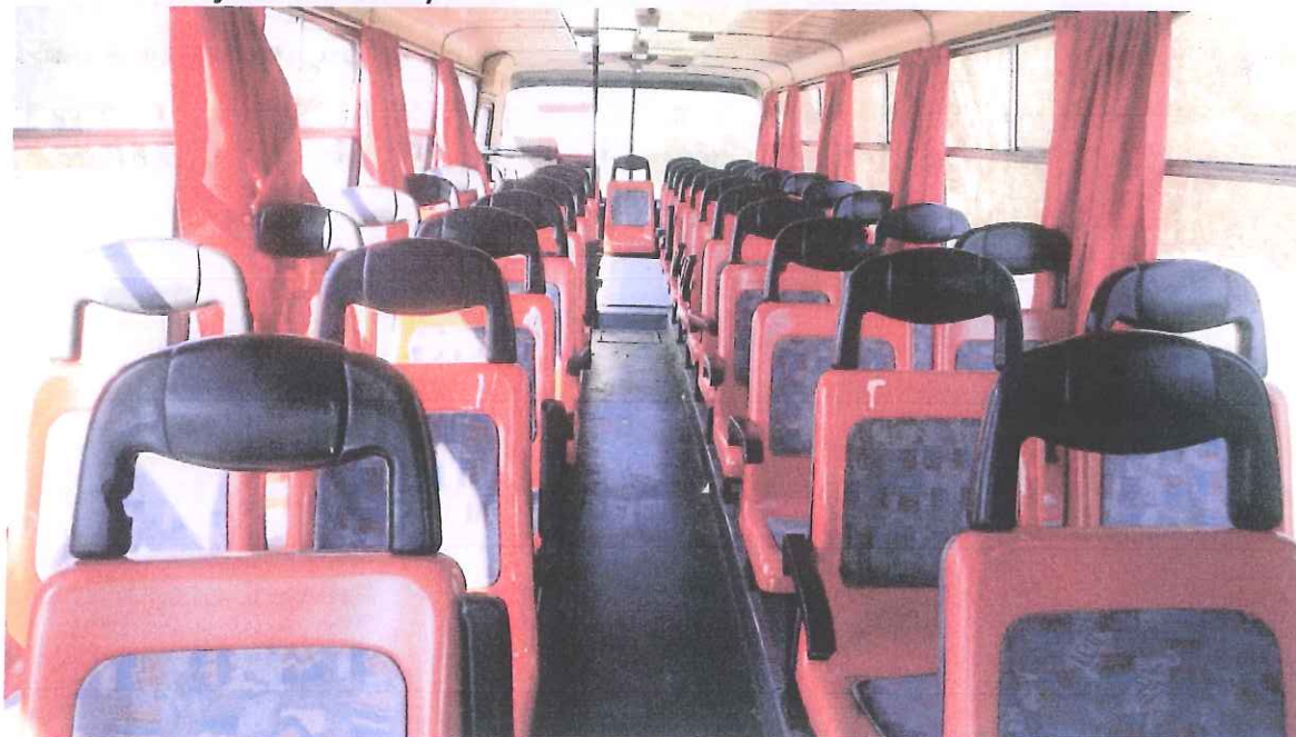
fot. 10 – wnętrze autobusu