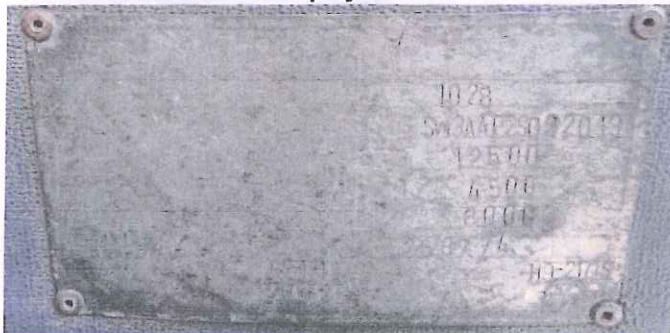
fot. 5 – tabliczka znamionowa