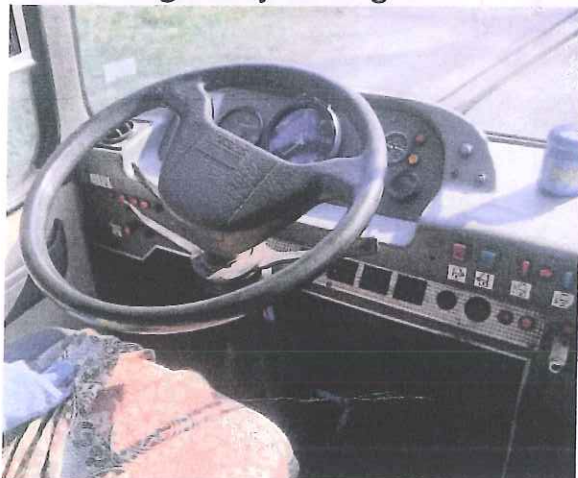
fot. 8 – miejsce kierowcy