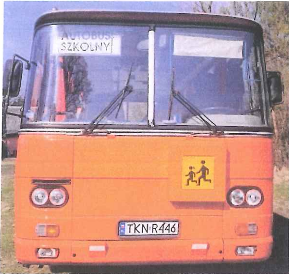
fot. 1 – przód pojazdu