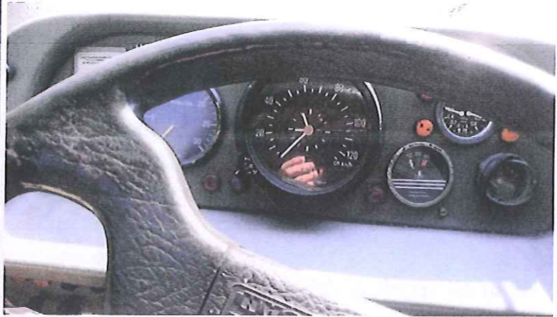
fot. 7 – zestaw wskaźników