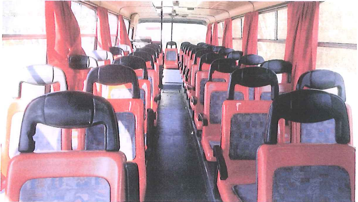
fot. 10 – wnętrze autobusu