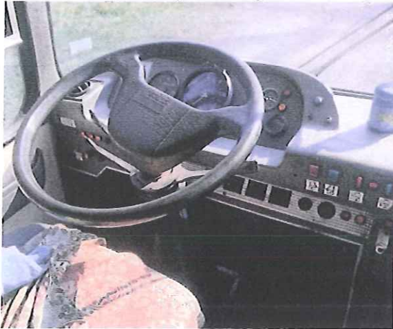
fot. 8 – miejsce kierowcy