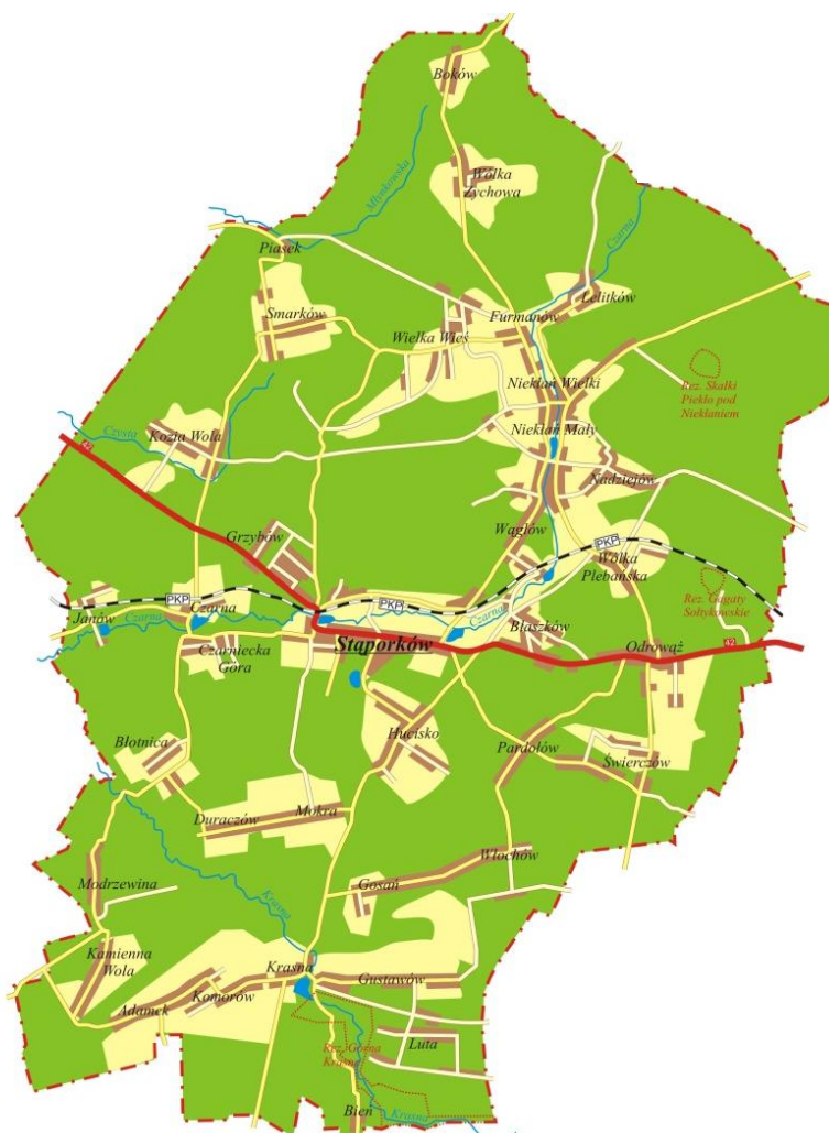
Rys. 2. Mapa Gminy Stąporków

Terytorium Gminy Stąporków obejmuje obszar o powierzchni 231,41 km 2 , dzieli się na 35 sołectw, które zamieszkuje łącznie ok. 18.000 mieszkańców.