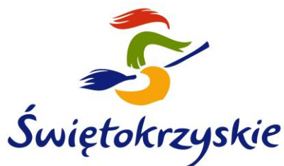
Rys. 1. Logo województwa świętokrzyskiego