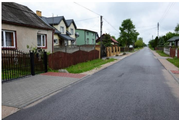
Droga w Grzybowie po remoncie.

Złożono wniosek o dofinansowanie w ramach Rządowego Funduszu Rozwoju Dróg – z uwagi na ograniczone środki finansowe w ramach alokacji Gmina nie uzyskała dofinansowania.