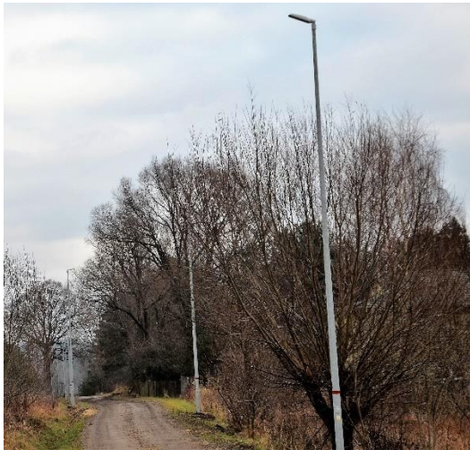
Nowe oświetlenie uliczne przy ul. Piaskowej w Wielkiej Wsi.