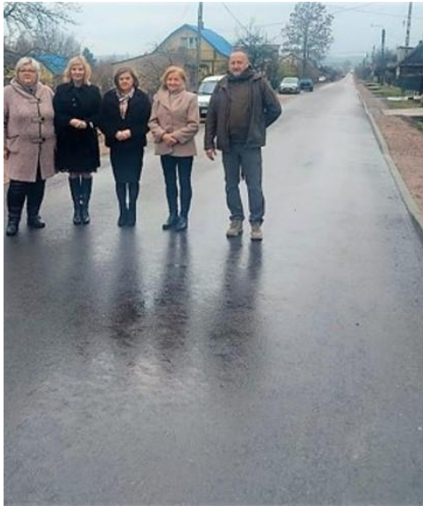
Droga powiatowa przez Gosz, której remont współfinansowała Gmina.