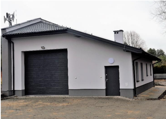
Nowy budynek remizy OSP w Czarnej.

8. Budowa budynku remizy Ochotniczej Straży Pożarnej w Czarnej wraz z instalacjami (499 160,01 PLN). Pozyskano dofinansowanie ze środków rządowych w wysokości 132 607,00 PLN.