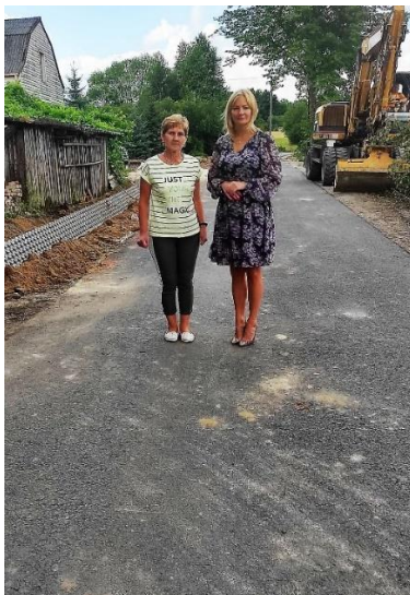
Ulica Nieklańska w Wielkiej Wsi w trakcie przebudowy.