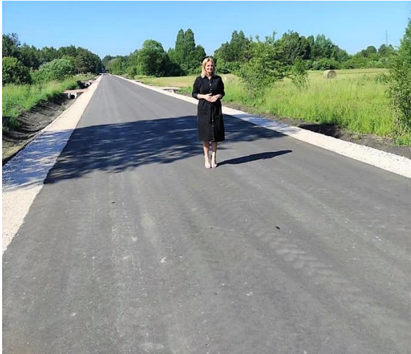
Droga Stąporków-Błaszaków po przebudowie.

Pozyskano dofinansowanie z Rządowego Funduszu Rozwoju Dróg w wysokości 426 348,17 PLN.