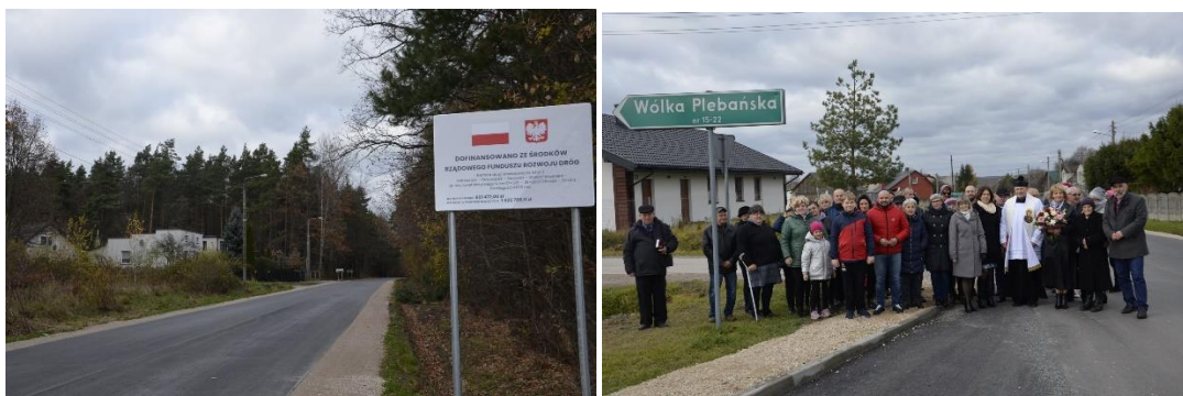
Droga powiatowa po remoncie, który współfinansowała Gmina.