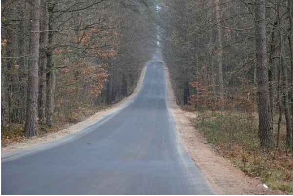
Droga powiatowa, której remont współfinansowała Gmina.