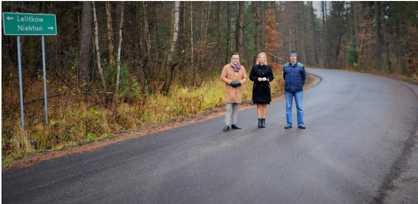
Droga powiatowa Niekłań-Furmanów-Lelitków, której remont współfinansowała Gmina.