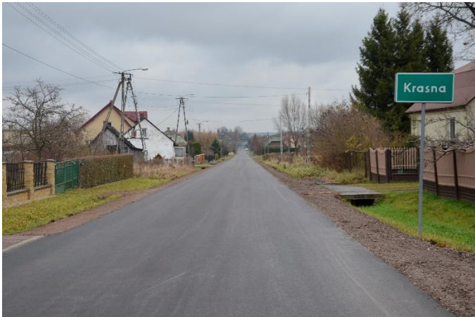
Droga powiatowa, której remont był współfinansowany przez Gminę.