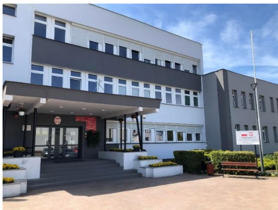
Elewacja zewnętrzna budynku Urzędu po odnowieniu.

Pozyskano dofinansowanie ze środków rządowych w wysokości 1 280 000,00 PLN.