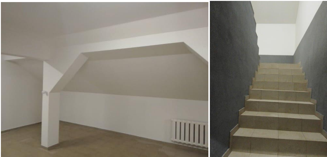
Remiza w Gosaniu po remoncie.