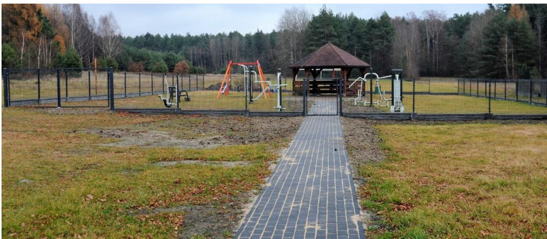
Plac zabaw w Kamiennej Woli po zakończeniu prac.