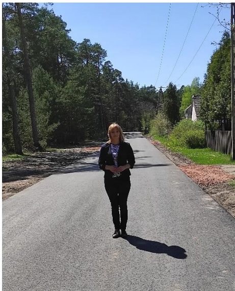
Droga gminna w Czarnieckiej Górze po przebudowie.

PLN). Pozyskano dofinansowanie z Rządowego Funduszu Rozwoju Dróg w wysokości 233 586,17 PLN.