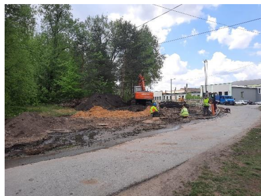
Prace przy budowie kanalizacji sanitarnej w Stąporkowie przy ul. Odlewniczej i Nieborowskiej.