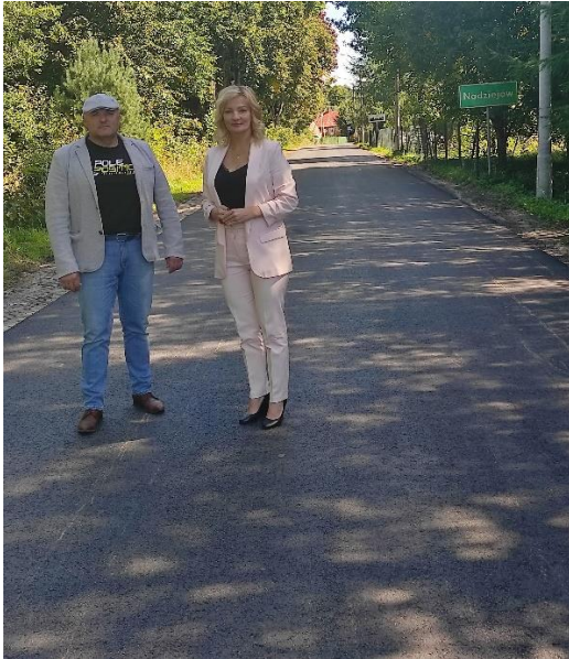
Droga gminna w Nadziejowie po remoncie.