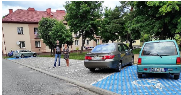
Utwardzony teren przy Placu Wolności w Stąporkowie.