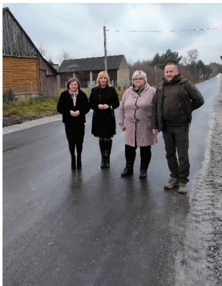
Gmina współfinansowała remont drogi powiatowej Stąporków-Pardolów.