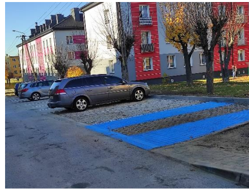
Utwardzone działki przy ul. Żeromskiego i Konopnickiej w Stąporkowie.