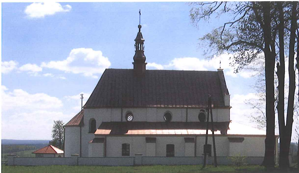
Fotografia nr 2. Kościół parafialny p.w. św. Jacka i Katarzyny w Odrowążu.

Wszelkie prace konserwatorskie i budowlane dotyczące obiektów wpisanych do rejestru zabytków były prowadzone zgodnie z wymogami Wojewódzkiego Konserwatora Zabytków, po uzyskaniu stosownej decyzji o prowadzeniu prac.