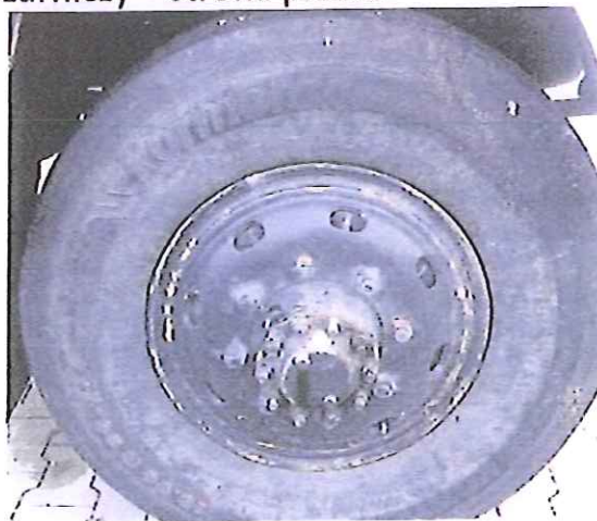
fot. 10 – koło prawe przednie