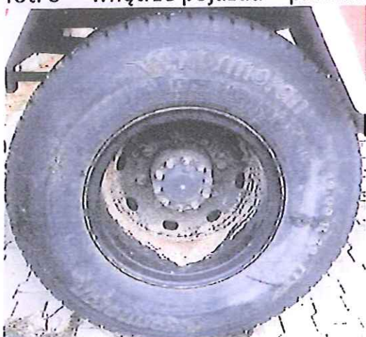
fot. 9 – koło tylne prawe