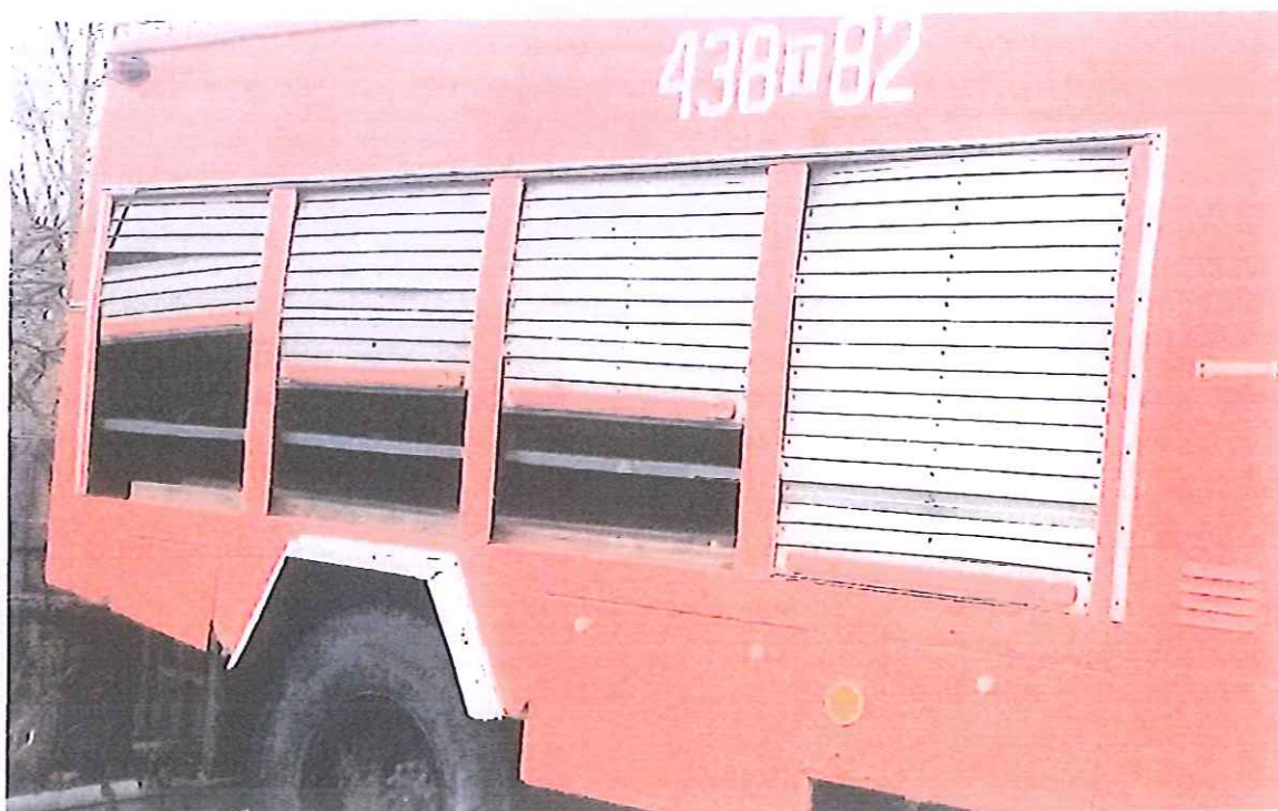
fot. 8 – wnętrze pojazdu - przedział pożarniczy – strona prawa