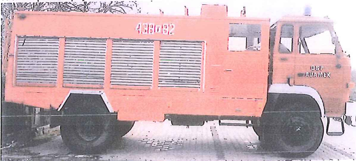
fot. 3 – prawa strona pojazdu