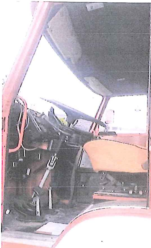
fot. 5 – wnętrze pojazdu