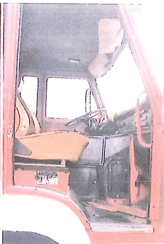
fot. 6 – wnętrze pojazdu