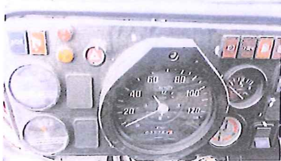
fot. 13 – zestaw wskaźników