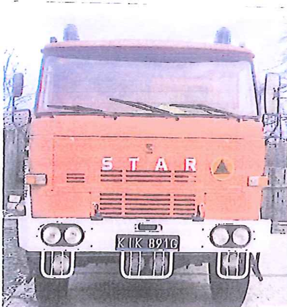
fot. 1 – przód pojazdu