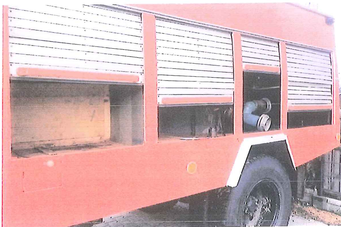
fot. 7 – wnętrze pojazdu – przedział pożarniczy – strona lewa