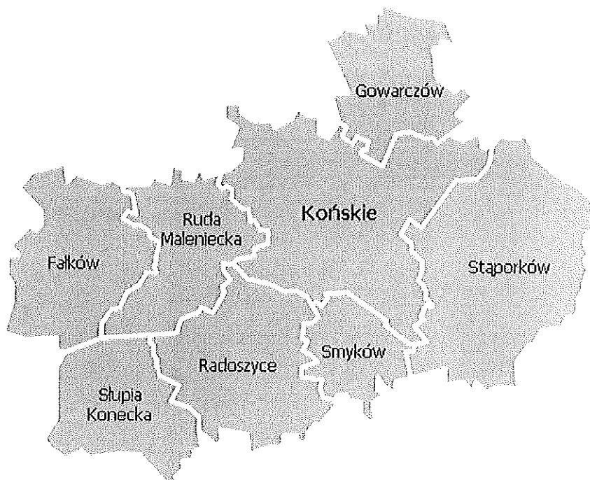
Rysunek 1. Powiat konecki